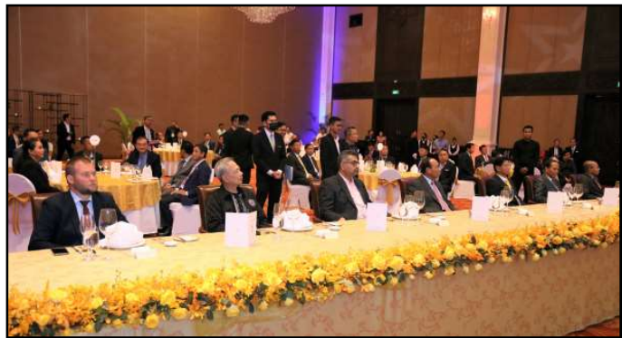
សកម្មភាពក្នុងពិធីលៀងសាយភោជន