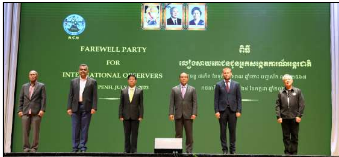
សកម្មភាពថតរូបអនុស្សាវរីយ៍

ប្រាថ្នាចង់បានការបោះឆ្នោតមួយដែលមានលក្ខណៈសេរី ត្រឹមត្រូវ និងយុត្តិធម៌ ដែលគ្រប់ភាគីទាំងអស់អាចទទួលយកបាន ។