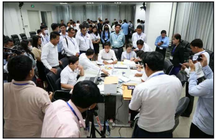
សកម្មភាពត្រួតពិនិត្យ និងផ្ទៀងផ្ទាត់

ជាលទ្ធផល ក្រុមត្រួតពិនិត្យ មិនបានរកឃើញកំហុស ឬភាពមិនប្រក្រតីណាមួយពាក់ព័ន្ធនឹងការគណនាគូលេខ លទ្ធផលសំឡេងឆ្នោតគាំទ្រគណបក្សនយោបាយនីមួយៗ ដែលគណៈកម្មការរាជធានី ខេត្តរៀបចំការបោះឆ្នោត ទាំង ២៥ បានបញ្ជាក់ក្នុងតារាងត្រួតពិនិត្យលទ្ធផលនៃការបោះឆ្នោតក្នុង ឃុំ សង្កាត់ (១.១១១៦តត) តារាងបូកសរុបលទ្ធផលនៃការ បោះឆ្នោតក្នុងរាជធានី ខេត្ត (១.១១១០) កំណត់ហេតុបូកសរុប លទ្ធផលនៃការបោះឆ្នោតក្នុងរាជធានី ខេត្ត (១.១១១១) និង ក្រដាសលទ្ធផលនៃការបោះឆ្នោតក្នុងរាជធានី ខេត្ត (១.១១១៤) ឡើយ។