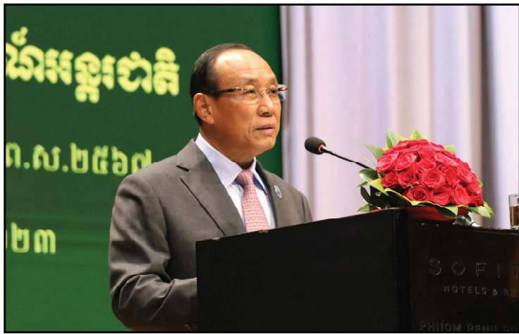
ឯកឧត្តម ប្រាជ្ញ ចន្ទ ប្រធាន គ.ជ.ប

ប្រធាន គ.ជ.ប ថ្លែងអំណរគុណដល់អ្នកសង្កេតការណ៍អន្តរជាតិ ដែលបានចូលរួមសង្កេតការណ៍បោះឆ្នោតជ្រើសតាំងតំណាងរាស្ត្រ នីតិកាលទី៧ ឆ្នាំ២០២៣