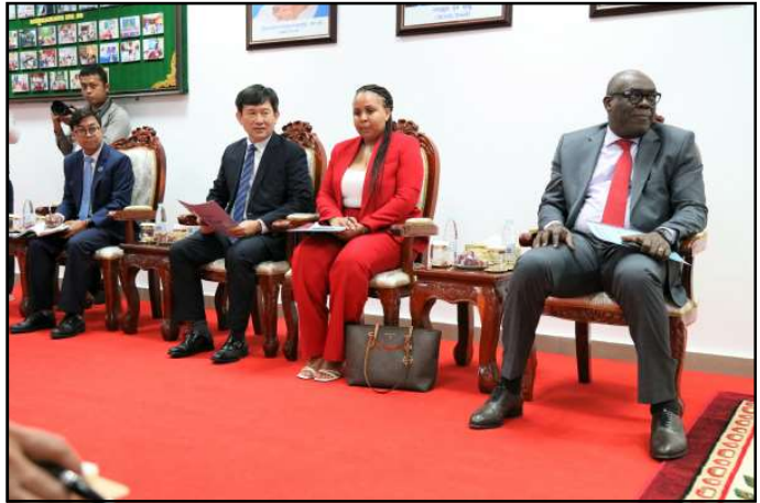
សកម្មភាពក្នុងជំនួបពិភាក្សា

ជាកិច្ចចាប់ផ្តើម ឯកឧត្តម ប្រាជ្ញ ចន្ទ មានមតិស្វាគមន៍ គណៈប្រតិភូស៊ីឌីអេអូ (CEDEAO) ដែលបានអញ្ជើញមកដល់ ទីស្តីការ គ.ជ.ប និងមានចំណាប់អារម្មណ៍អំពីការបោះឆ្នោត ជ្រើសតាំងតំណាងរាស្ត្រ នីតិកាលទី៧ ។