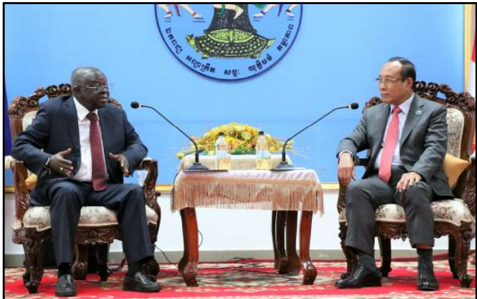
(រូបខាងស្តាំ) ឯកឧត្តម ប្រាជ្ញ ចន្ទ ប្រធាន គ.ជ.ប និងឯកឧត្តម រ៉េម៉ាន់ដូ ភីរ៉េរ៉ា ប្រធានគណៈប្រតិភូសហគមន៍ សេដ្ឋកិច្ចនៃរដ្ឋអាហ្វ្រិកខាងលិច

នារសៀលថ្ងៃទី២៥ ខែកក្កដា ឆ្នាំ២០២៣ វេលាម៉ោង ១៦:០០ នៅទីស្តីការគណៈកម្មាធិការជាតិរៀបចំការបោះឆ្នោត (គ.ជ.ប) ឯកឧត្តម ប្រាជ្ញ ចន្ទ ប្រធាន គ.ជ.ប បានទទួលជួប ឯកឧត្តម រ៉េម៉ាន់ដូ ភីរ៉េរ៉ា (H.E.Mr. Raimundo PEREIRA) ប្រធានគណៈប្រតិភូសហគមន៍សេដ្ឋកិច្ចនៃរដ្ឋអាហ្វ្រិកខាងលិច (La Communauté économique des États de L'Afrique de L'Ouest "CEDEAO") និងជាសមាជិកបណ្តាញពង្រឹង សមត្ថភាពរៀបចំការបោះឆ្នោតនៃប្រទេសនិយាយភាសាបារាំង ដែលបានមកសង្កេតការណ៍បោះឆ្នោតជ្រើសតាំងតំណាងរាស្ត្រ នីតិកាលទី៧ ឆ្នាំ២០២៣ ។