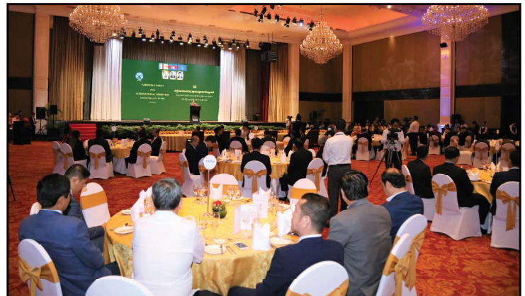
តទៅទំព័រទី២

វត្តមានអ្នកសង្កេតការណ៍បោះឆ្នោតអន្តរជាតិ និងតំណាងស្ថានទូតប្រចាំព្រះរាជាណាចក្រកម្ពុជាទាំងអស់ ដែលអញ្ជើញមកសង្កេតការណ៍បោះឆ្នោតជ្រើសតាំងតំណាងរាស្ត្រ នីតិកាលទី៧ ឆ្នាំ២០២៣