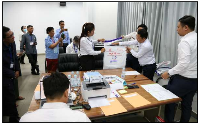
សកម្មភាពត្រួតពិនិត្យ និងផ្ទៀងផ្ទាត់

ក្រុមត្រួតពិនិត្យលទ្ធផលនៃ គ.ជ.ប ត្រូវបែងចែកជា ៥ ក្រុម ដោយក្រុមនីមួយៗទទួលបន្ទុក ចំនួន ៥ មណ្ឌលបោះឆ្នោត និងធ្វើការត្រួតពិនិត្យ និងផ្ទៀងផ្ទាត់លទ្ធផលនៃការបោះឆ្នោត ម្តងមួយមណ្ឌលៗ យ៉ាងល្អិតល្អន់ តាមប្រមាណវិធីដោយដៃ និង