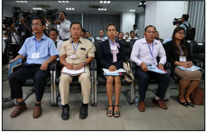
ភាគីពាក់ព័ន្ធចូលរួមក្នុងកិច្ចប្រជុំ

ខិត្តបណ្ណតាមខ្នងផ្ទះ និងតាមផ្សារ ការចាក់មេក្រូផ្សព្វផ្សាយនៅ តាមទីស្នាក់ការគណបក្សនយោបាយ និងចាក់មេក្រូចល័តតាម ភូមិជាដើម។ ឯកឧត្តមបានបន្តថា ក្នុងចំណោមគណបក្សនយោ- បាយឈរឈ្មោះបោះឆ្នោតទាំង ១៨ មានគណបក្សចំនួន ១៦ បានធ្វើសកម្មភាពហែក្បួនរយោសនាបោះឆ្នោតនៅតាមមណ្ឌល បោះឆ្នោតនានា ដែលខ្លួនមានបញ្ជីបេក្ខជនឈរឈ្មោះ ក្នុងនោះ គ.ជ.ប បានកត់សម្គាល់ឃើញថា ក្បួនរយោសនារបស់គណបក្ស ប្រជាជនកម្ពុជា មានទំហំធំ និងមានអ្នកចូលរួមច្រើនជាងគេ។ គ.ជ.ប សង្កេតឃើញថា រយៈពេល ២១ ថ្ងៃ នេះ មានអ្នក ចូលរួមរយោសនាបោះឆ្នោតរបស់គណបក្សនយោបាយសរុប ២.២៣៦.៧៩៤ នាក់ ប្រើថវិកាយោសនាមាន ៩៩.៧៩៤ គ្រឿង ទោចក្រយានយន្ត ៧២២.៧៣៣ គ្រឿង ម៉ូតូកុងប៊ី ១០.២៤០ គ្រឿង គោយន្ត ៣.៤៩១ គ្រឿង កាណូត ៨៥៧ គ្រឿង និងទោចក្រយាន