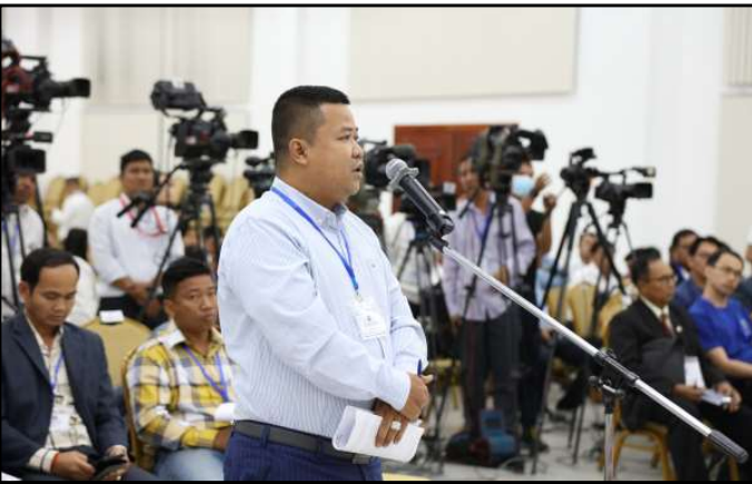
ភាគីពាក់ព័ន្ធមានចំណាប់អារម្មណ៍ និងសំណួរក្នុងកិច្ចប្រជុំ

ឯកឧត្តមប្រធាន គ.ជ.ប បានជម្រាបជូនអំពីសភាព-ការណ៍មុនថ្ងៃបោះឆ្នោតថា ៖