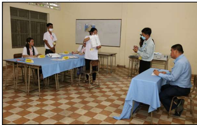
សកម្មភាពរាប់សន្លឹកឆ្នោត

ជ្រើសតាំងតំណាងរាស្ត្រ នីតិកាលទី៧ ឆ្នាំ២០២៣ ។