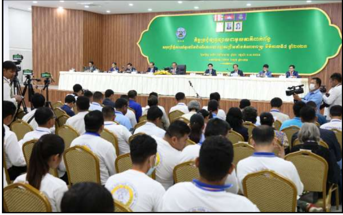
សកម្មភាពក្នុងកិច្ចប្រជុំជាមួយភាគីពាក់ព័ន្ធ

ឆ្នោតពាក់ព័ន្ធ និងតំណាងគណបក្សនយោបាយឈរឈ្មោះបោះឆ្នោត និងត្រូវបានជូនដំណឹង ឬផ្សព្វផ្សាយយ៉ាងទូលំទូលាយដល់ប្រជាពលរដ្ឋ និងភាគីពាក់ព័ន្ធផងដែរ មុនថ្ងៃបោះឆ្នោត ។