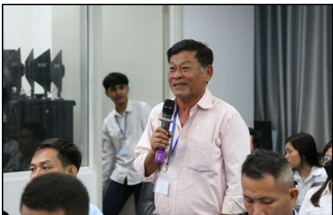
ភាគីពាក់ព័ន្ធមានចំណាប់អារម្មណ៍ និងសំណួរក្នុងកិច្ចប្រជុំ

ពាក់ព័ន្ធនឹងការបិទផ្សាយបញ្ជីបោះឆ្នោត និងលេខកូដ ការិយាល័យបោះឆ្នោតនៅតាមការិយាល័យបោះឆ្នោត ឯកឧត្តម