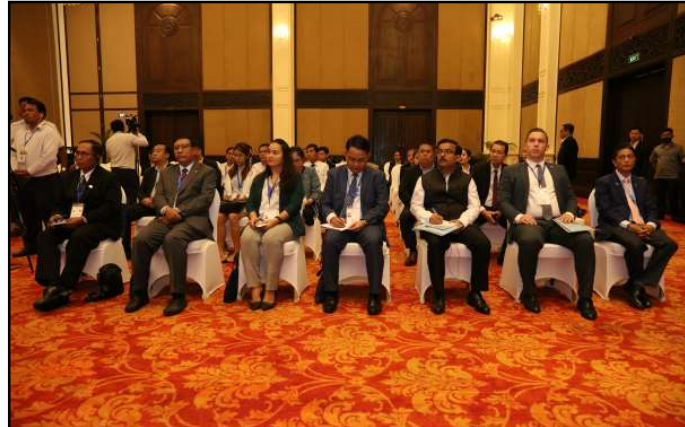
សកម្មភាពក្នុងកិច្ចប្រជុំ