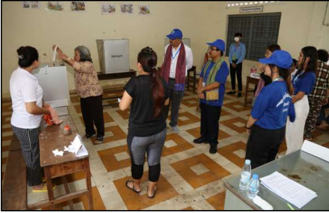
សកម្មភាពប្រជាពលរដ្ឋមកបោះឆ្នោត

សម្ងាត់ ហិបឆ្នោត ទឹកខ្មៅជ្រលក់ម្រាមដៃ ដែលអ្នកបោះឆ្នោតត្រូវជ្រលក់បញ្ជាក់ថាបានបោះឆ្នោតរួចហើយ - ស្ត្រីកម្ពុជា ក្លាហានជ្រលក់ម្រាមដៃនឹងទឹកខ្មៅលាងមិនជ្រះ ដែលជាទូទៅស្ត្រីត្រូវការម្រាមដៃស្អាត - មន្ត្រីការិយាល័យបោះឆ្នោតមានពាក់អាវសម្គាល់ហើយភ្នាក់ងារគណបក្សនយោបាយ អ្នកសង្កេតការណ៍បោះឆ្នោត និងអ្នកសារព័ត៌មាន មានបណ្ណសម្គាល់ខ្លួនផងដែរ។ ទាំងនេះបញ្ជាក់ថា ដំណើរការបោះឆ្នោតនិងរាប់សន្លឹកឆ្នោតបានប្រព្រឹត្តទៅស្របតាមច្បាប់របស់ព្រះរាជាណាចក្រកម្ពុជា។