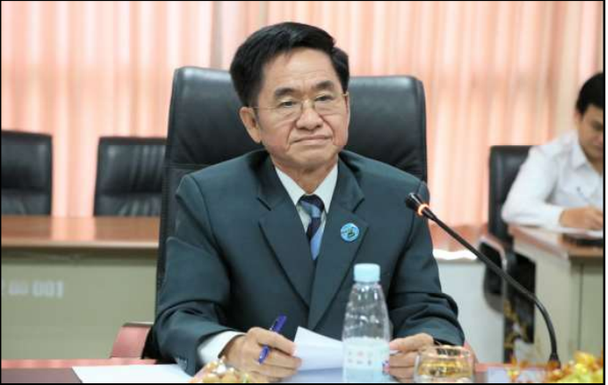
ឯកឧត្តម ហង្ស ពុទ្ធា សមាជិក និងជាប្រធានក្រុមអ្នកនាំពាក្យ គ.ជ.ប

នារសៀលថ្ងៃទី២០ ខែកក្កដា ឆ្នាំ២០២៣ វេលាម៉ោង ២:០០ នៅទីស្តីការគណៈកម្មាធិការជាតិរៀបចំការបោះឆ្នោត (គ.ជ.ប) ឯកឧត្តម ហង្ស ពុទ្ធា សមាជិក គ.ជ.ប និងជាប្រធានក្រុមអ្នកនាំពាក្យ គ.ជ.ប បានទទួលជួបលោក ណាអូតូ សាកាហ្គុជិ (Mr. Naoto Sakaguchi) ប្រធានក្រុមអ្នកសង្កេតការណ៍បោះឆ្នោតអន្តរជាតិមកពីប្រទេសជប៉ុនរួមទាំងសហការី ចំនួន ៧ (ប្រាំពីរ) រូប ដើម្បីសម្តែងការគួរសម និងស្វែងយល់ពីការបោះឆ្នោតជ្រើសតាំងតំណាងរាស្ត្រ នីតិកាលទី៧ ឆ្នាំ២០២៣ ។