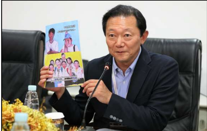
លោក ណាអូតូ សាកាហ្គុជិ ប្រធានក្រុមអ្នកសង្កេតការណ៍បោះឆ្នោតអន្តរជាតិមកពីប្រទេសជប៉ុន

ឯកឧត្តម ហង្ស ពុទ្ធា បានជម្រាបជូនគណៈប្រតិភូ អំពីប្រវត្តិនៃការបោះឆ្នោតនៅកម្ពុជាថា នៅឆ្នាំ១៩៩៣ គឺជាការបោះឆ្នោតជ្រើសរើសសភាធម្មនុញ្ញ ដែលការបោះឆ្នោតនោះ បានរៀបចំដោយអាជ្ញាធរបណ្តោះអាសន្ននៃអង្គការសហប្រជាជាតិប្រចាំនៅកម្ពុជា ហៅកាត់ថា "UNTAC" ។ ឯកឧត្តមបានបន្តថា នៅឆ្នាំ១៩៩៨ ប្រទេសកម្ពុជាបានរៀបចំការបោះឆ្នោតដោយខ្លួនឯង និងបានរៀបចំការបោះឆ្នោតជាបន្តបន្ទាប់មកទៀតរហូតមកដល់បច្ចុប្បន្ន ។ រហូតមកទល់ពេលនេះ គ.ជ.ប បានរៀបចំការបោះឆ្នោតដោយខ្លួនឯងយ៉ាងទៀងទាត់ ទាំងសកល និង