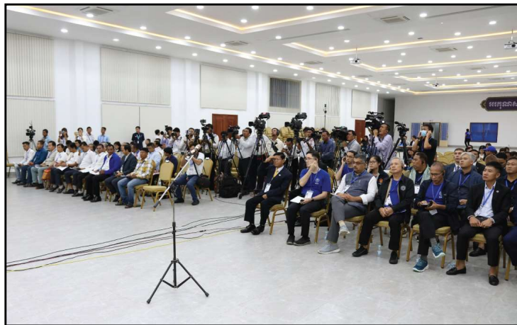
តទៅទំព័រទី២

(NIE) ឯកឧត្តម ប្រាជ្ញ ចន្ទ ប្រធានគណៈកម្មាធិការជាតិរៀបចំការបោះឆ្នោត (គ.ជ.ប) បានធ្វើការបូកសរុបព្រឹត្តិការណ៍ ថ្ងៃបោះឆ្នោត