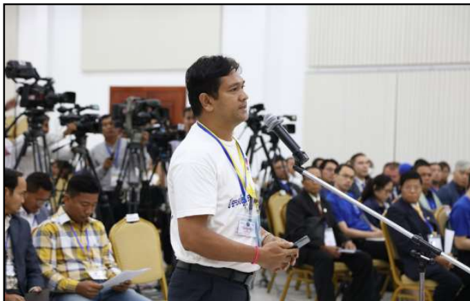
ភាគីពាក់ព័ន្ធមានចំណាប់អារម្មណ៍ និងសំណួរក្នុងកិច្ចប្រជុំ