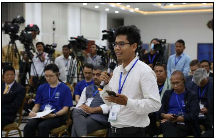
ភាគីពាក់ព័ន្ធមានចំណាប់អារម្មណ៍ និងសំណួរក្នុងកិច្ចប្រជុំ