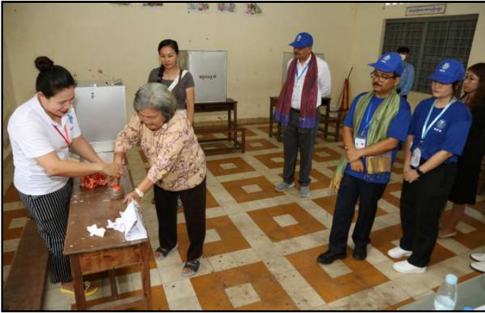
សកម្មភាពប្រជាពលរដ្ឋមកបោះឆ្នោត

ឧបករណ៍គ្រឿងសង្ហារឹម មានពន្លឺ មានលំហដ៏ត្រឹមត្រូវសម្រាប់បោះឆ្នោត ត្រូវបានរៀបចំជាស្រេចនៅមុនថ្ងៃបោះឆ្នោត