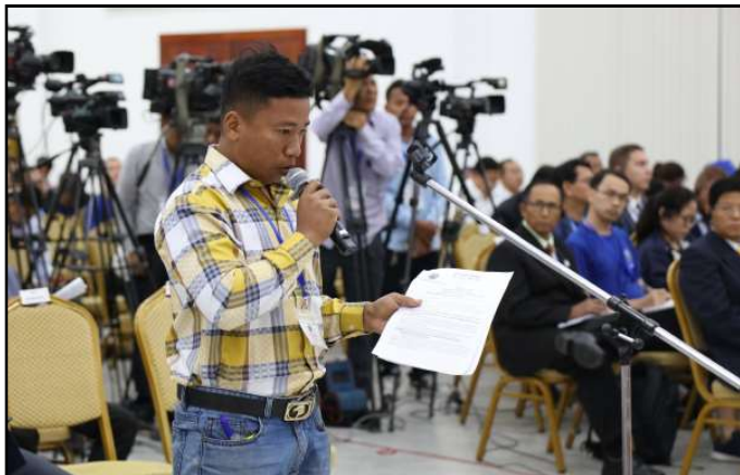
ភាគីពាក់ព័ន្ធមានចំណាប់អារម្មណ៍ និងសំណួរក្នុងកិច្ចប្រជុំ

ដំណើរការលូនល្អ និងប្រកបដោយសន្តិសុខ និងសុវត្ថិភាព