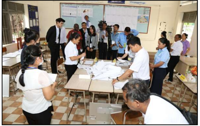
សកម្មភាពរាប់សន្លឹកឆ្នោត