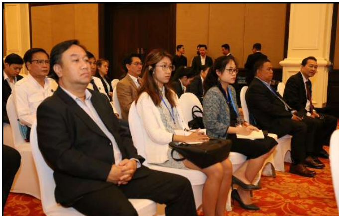
សកម្មភាពក្នុងកិច្ចប្រជុំ

ចំណាប់អារម្មណ៍របស់ ឯកឧត្តម វ៉ាង វិនជៀន (H.E.