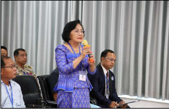
សំណួរ និងចំណាប់អារម្មណ៍របស់ភាគីពាក់ព័ន្ធ

- ផ្នែកសឹករងក្រុង ស្រុក ខណ្ឌ ដែលមានកម្លាំងសរុប ចំនួន ១៩.៧២៤ នាក់។