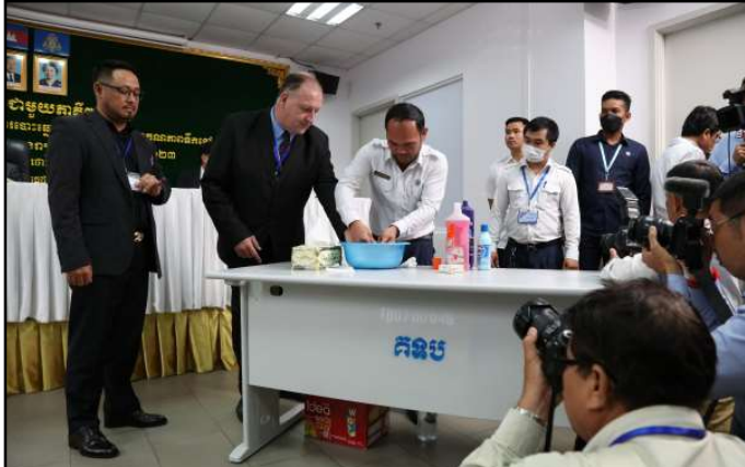
សកម្មភាពភាគីពាក់ព័ន្ធធ្វើតេស្តទឹកខ្មៅលុបមិនជ្រះ

ឯកឧត្តមប្រធាន គ.ជ.ប បានបន្តទៀតថា មន្ត្រីជំនាញ នៃអគ្គលេខាធិការដ្ឋាន គ.ជ.ប បានធ្វើការសាកល្បងគំរូទឹកខ្មៅ លុបមិនជ្រះដែលក្រុមហ៊ុនបានផ្តល់ជូន ចំនួន ៤ កម្រិតនេះ ឃើញថា ទឹកខ្មៅលុបមិនជ្រះកម្រិតសូលុយស្យុងប្រាក់នីត្រាត ២០% មានគុណភាពល្អ ជាពិសេសភាពជិតខ្មៅជាប់នឹងស្បែក ដៃ ក្រចក និងគល់ក្រចក ព្រមទាំងកម្រិតស្អាតលឿនក្នុងបរិយាកាសមិនអាចលុបជ្រះភ្លាមៗបានឡើយ ហើយគុណភាពនេះ ប្រហាក់ប្រហែលនឹងគុណភាពទឹកខ្មៅលុបមិនជ្រះដែល គ.ជ.ប បានប្រើប្រាស់ក្នុងការបោះឆ្នោតកន្លងមក ដែលអាចធានាបាន ទាំងគុណភាពប្រើប្រាស់ និងអាចធានាបានទាំងសុខភាពរបស់