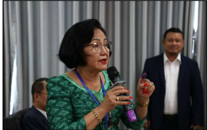
សំណួរ និងចំណាប់អារម្មណ៍របស់ភាគីពាក់ព័ន្ធ

គ.ជ.ប បានបញ្ជាក់ជូនថា សម្រាប់ការបោះឆ្នោត ឆ្នាំ២០២៣ នេះ គ.ជ.ប មានវិធានការគ្រប់គ្រាន់ចំពោះជន ដែលយោសនាមិនពិតអំពីទឹកខ្មៅជ្រលក់ដៃនេះ។ វិធានការបង្ការ មិនឱ្យបោះឆ្នោតលើសពីមួយដង មិនមែនមានតែការប្រើទឹកខ្មៅ លុបមិនជ្រះប៉ុណ្ណោះទេ គ.ជ.ប មានវិធានការជាច្រើនទៀត