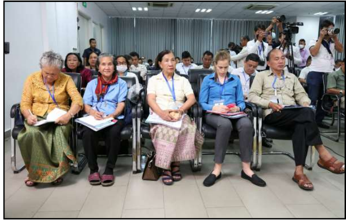
តំណាងភាគីពាក់ព័ន្ធចូលរួមក្នុងកិច្ចប្រជុំ

នូវសកម្មភាពយោសនាបោះឆ្នោត និងសារនយោបាយរបស់គណបក្សនយោបាយនៅលើបណ្តាញព័ត៌មានសង្គមហ្វេសប៊ុក (FACEBOOK) ជារៀងរាល់ថ្ងៃផងដែរ ។