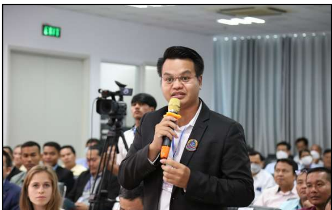
សំណួរ និងចំណាប់អារម្មណ៍របស់ភាគីពាក់ព័ន្ធ