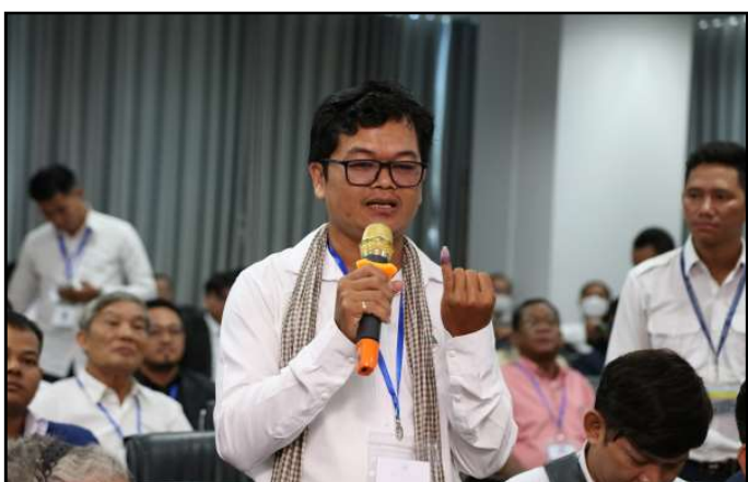
សំណួរ និងចំណាប់អារម្មណ៍របស់ភាគីពាក់ព័ន្ធ

ក្នុងកិច្ចប្រជុំជាមួយភាគីពាក់ព័ន្ធនឹងការបោះឆ្នោតនេះ មានការអញ្ជើញចូលរួមពីតំណាង ក្រុមប្រឹក្សាធម្មនុញ្ញ អគ្គលេខាធិការដ្ឋានព្រឹទ្ធសភា ក្រសួងមហាផ្ទៃ ក្រសួងព័ត៌មាន អគ្គស្នងការដ្ឋាននគរបាលជាតិ ស្ថានទូតឥណ្ឌា គណបក្សនយោបាយ សមាគម និងអង្គការមិនមែនរដ្ឋាភិបាល និងអ្នកសារព័ត៌មាន ចំនួនប្រមាណ ១០០ នាក់។