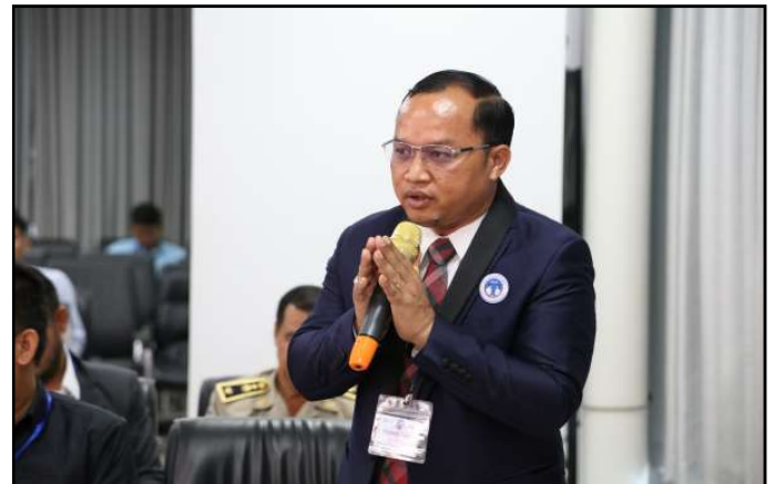
សំណួរ និងចំណាប់អារម្មណ៍របស់ភាគីពាក់ព័ន្ធ

បានបញ្ជាក់ជូនថា គណៈកម្មាធិការជាតិរៀបចំការបោះឆ្នោត ក៏បានដាក់ចេញនូវសេចក្តីណែនាំលេខ ០៣៧ គ.ជ.ប ស.ណ.ន ចុះថ្ងៃទី១៥ ខែឧសភា ឆ្នាំ២០២៣ ស្តីពីការហែកូនយោសនា បោះឆ្នោត និងការធ្វើសកម្មភាពចែកខិត្តបណ្ណនៅក្នុងផ្សាររបស់ គណបក្សនយោបាយ សម្រាប់ការបោះឆ្នោតជ្រើសតាំងតំណាង រាស្ត្រ នីតិកាលទី៧ ឆ្នាំ២០២៣ ផងដែរ ដើម្បីកំណត់ទម្រង់ និងទំហំនៃការហែកូនយោសនាបោះឆ្នោត ក្នុងគោលបំណង ធ្វើយ៉ាងណាឱ្យគណបក្សនយោបាយយកចិត្តទុកដាក់គោរព និងរក្សាឱ្យបាននូវសណ្តាប់ធ្នាប់ល្អ តាមដងផ្លូវ ទីប្រជុំជន តាម ទីសាធារណៈ និងយកចិត្តទុកដាក់គោរពច្បាប់ចរាចរណ៍ផ្លូវ គោក។