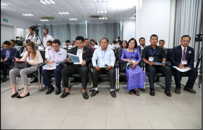
តំណាងភាគីពាក់ព័ន្ធចូលរួមក្នុងកិច្ចប្រជុំ