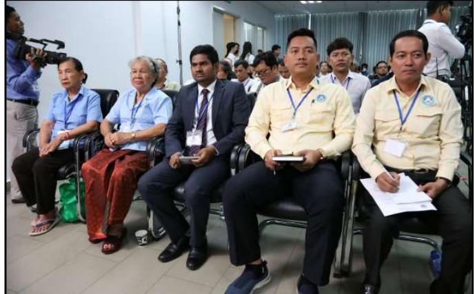
តំណាងភាគីពាក់ព័ន្ធចូលរួមក្នុងកិច្ចប្រជុំ

មានសិទ្ធិបោះឆ្នោត គឺបោះឆ្នោតបានតែមួយសន្លឹកប៉ុណ្ណោះ។ ឯកឧត្តមបានបន្តថា មិនខុសពីការបោះឆ្នោតនីតិកាលមុនៗ ការ បោះឆ្នោតជ្រើសតាំងតំណាងរាស្ត្រ នីតិកាលទី៧ ឆ្នាំ២០២៣ នេះ គ.ជ.ប នៅតែបន្តរក្សាការប្រើប្រាស់ទឹកខ្មៅលុបមិនជ្រះរបស់ ក្រុមហ៊ុន MYSORE PAINTS & VARNISH LTD. នៃប្រទេស ឥណ្ឌា ដែលជាក្រុមហ៊ុនមានឯកទេសក្នុងការផលិតទឹកខ្មៅនេះ និងធ្លាប់បានផ្គត់ផ្គង់ជូន គ.ជ.ប រៀងរាល់ការបោះឆ្នោត ហើយ ក៏មានប្រទេសជាង ៣០ នៅលើសកលលោក បានប្រើប្រាស់ ទឹកខ្មៅរបស់ក្រុមហ៊ុននេះ ដែលមានដូចជា ឥណ្ឌា (ខ្លួនឯង) កម្ពុជា ម៉ាឡេស៊ី នេប៉ាល់ អាហ្វ្រិកខាងត្បូង ប៉ាគីស្ថាន និង អាហ្កានីស្ថាន។ល។