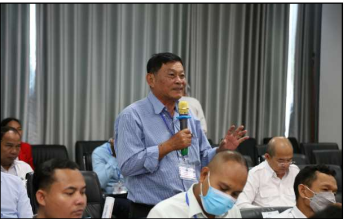
សំណួរ និងចំណាប់អារម្មណ៍របស់ភាគីពាក់ព័ន្ធ