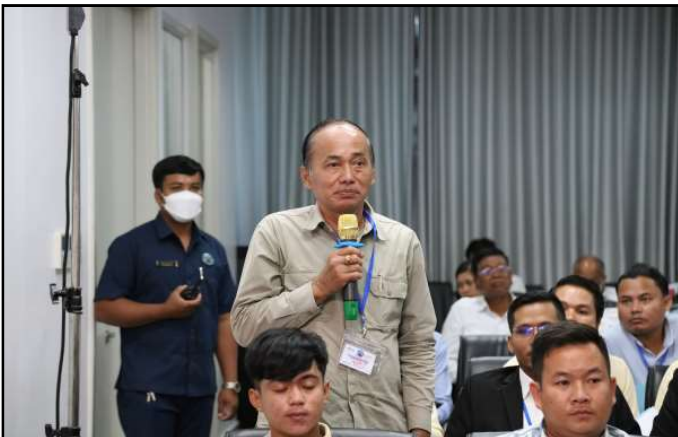
ចំណាប់អារម្មណ៍ និងសំណួររបស់ភាគីពាក់ព័ន្ធ

ចំពោះការគោរពច្បាប់ចរាចរណ៍ ឯកឧត្តម ឌឹម សុវណ្ណារុំ