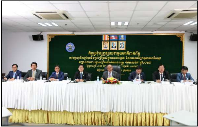
គណៈអធិបតីក្នុងកិច្ចប្រជុំជាមួយភាគីពាក់ព័ន្ធ

ដូចជា៖ ការតម្រូវឱ្យលេខាធិការយកចិត្តទុកដាក់ផ្ទៀងផ្ទាត់អត្តសញ្ញាណ គុសសញ្ញាធីកត្រង់ឈ្មោះអ្នកបោះឆ្នោតដែលបានអញ្ជើញ មកបោះឆ្នោតក្នុងបញ្ជីបោះឆ្នោត ដើម្បីសម្គាល់ថា អ្នកបោះឆ្នោត នោះបានបោះឆ្នោតរួច កិច្ចដំណើរការទាំងអស់ត្រូវបានដាក់ឱ្យ ស្ថិតក្រោមការតាមដានត្រួតពិនិត្យពីភ្នាក់ងារគណបក្សនយោបាយ និងអ្នកសង្កេតការណ៍នៅក្នុងការិយាល័យបោះឆ្នោត។ល។ ម្យ៉ាងទៀត គ.ជ.ប បានប្រើប្រាស់ទឹកខ្មៅជ្រលក់ដែលសម្រាប់ រៀបចំការបោះឆ្នោតជាសកលនេះ ៦ លើករួចមកហើយ ពុំទាន់ មានជនណាម្នាក់បន្លំខ្លួនមកបោះឆ្នោត ២ ដងនោះទេ។ ករណី នេះ ប្រសិនបើមាននោះ គ.ជ.ប នឹងចាត់វិធានការតាមច្បាប់។ បន្ទាប់ពីឆ្លើយនឹងសំណួររបស់សព្វគ្រប់ គ.ជ.ប បាន