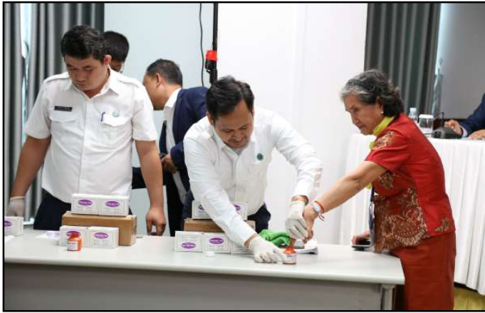
សកម្មភាពភាគីពាក់ព័ន្ធធ្វើតេស្តទឹកខ្មៅលុបមិនជ្រះ

មកនេះ គ.ជ.ប បានស្នើសុំគំរូទឹកខ្មៅលុបមិនជ្រះដើម្បីសាកល្បង គុណភាពជាមុនពីក្រុមហ៊ុន មានចំនួន ៤ កម្រិត គឺ៖