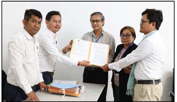
គណបក្សប្រជាធិបតេយ្យមូលដ្ឋាន