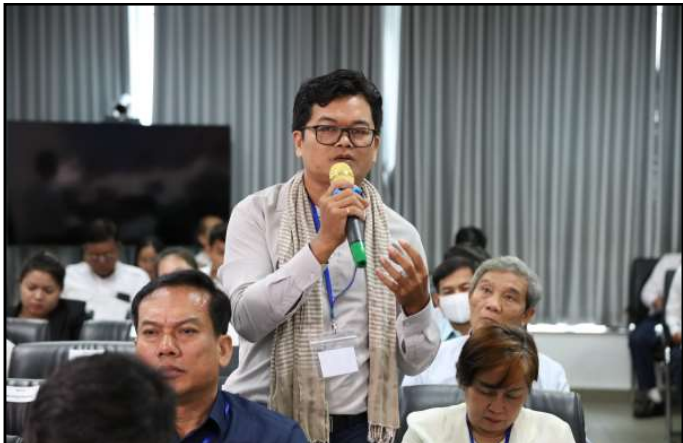
តំណាងភាគីពាក់ព័ន្ធមានសំណួរក្នុងកិច្ចប្រជុំ

មានសំណួររបស់ភាគីចូលរួមក្នុងកិច្ចប្រជុំ ពាក់ព័ន្ធនឹង