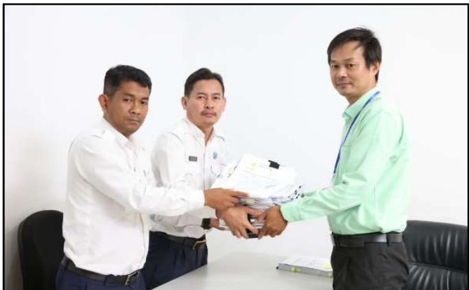
គណបក្សសញ្ជាតិកម្ពុជា