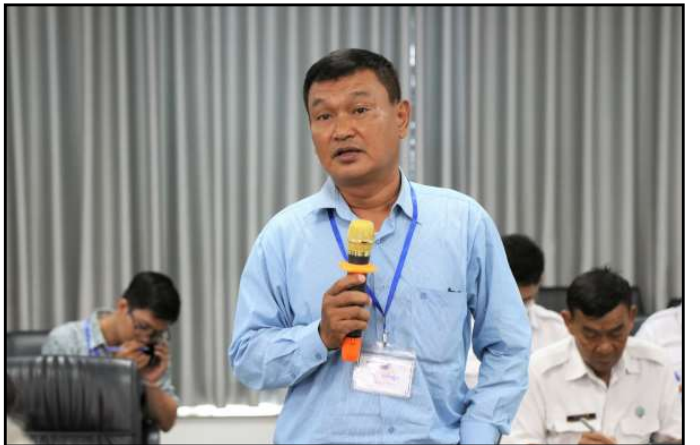
តំណាងភាគីពាក់ព័ន្ធមានសំណួរក្នុងកិច្ចប្រជុំ

តំណាង គ.ជ.ប បានឆ្លើយក្នុងអង្គប្រជុំនោះថា គ.ជ.ប ពិនិត្យពាក្យសុំចុះបញ្ជីរបស់គណបក្សនយោបាយឈរឈ្មោះ បោះឆ្នោតក្នុងរយៈពេលយ៉ាងយូរ ៧ (ប្រាំពីរ) ថ្ងៃ បន្ទាប់ពីទទួលបានពាក្យសុំ។ ក្នុងករណី គ.ជ.ប យល់ព្រមចុះបញ្ជីគណបក្សនយោបាយឈរឈ្មោះបោះឆ្នោត គ.ជ.ប ត្រូវចេញលិខិតបញ្ជាក់ការចុះបញ្ជីគណបក្សនយោបាយឈរឈ្មោះបោះឆ្នោត ជូនសាមី