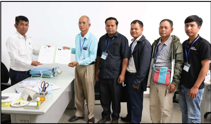
គណបក្សជនជាតិដើមប្រជាធិបតេយ្យកម្ពុជា