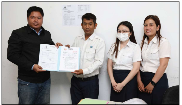
គណបក្សកសិករ