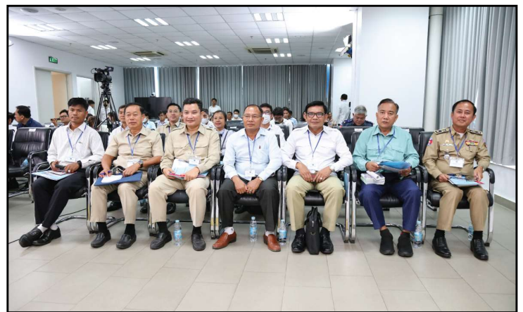
តទៅទំព័រទី២

ភាគីពាក់ព័ន្ធនឹងការបោះឆ្នោតក្រោមអធិបតីភាព ឯកឧត្តម មាន សទិ សមាជិក គ.ជ.ប និងជាប្រធានដឹកនាំកិច្ចប្រជុំ ដែលមានប្រធានបទ