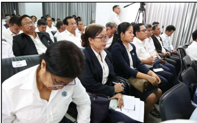
អ្នករាជការ គ.ជ.ប ចូលរួមក្នុងពិធីបិទវគ្គបណ្តុះបណ្តាល