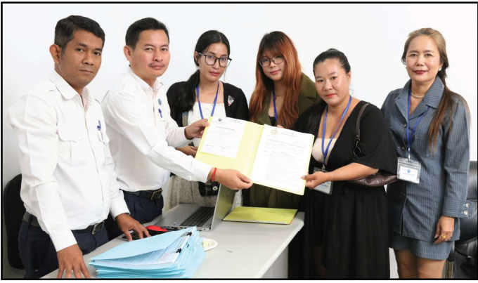
គណបក្សស្រ្តីដើម្បីស្រ្តី