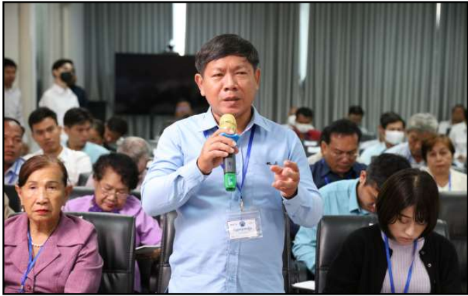
តំណាងភាគីពាក់ព័ន្ធមានសំណួរក្នុងកិច្ចប្រជុំ

មិនមែនរដ្ឋាភិបាល ឬសមាគមនោះ បានស្នើសុំតែប៉ុណ្ណោះ លើកលែងតែអ្នកសង្កេតការណ៍ជាតិចល័តទូទាំងប្រទេស ដែលត្រូវបានអនុញ្ញាត និងផ្តល់បណ្ណសម្គាល់ដោយ គ.ជ.ប។ ឯកឧត្តមបានបន្តថា ចំពោះអ្នកសង្កេតការណ៍អន្តរជាតិ អាចធ្វើដំណើរគ្រប់ទីកន្លែងក្នុងដែនដីនៃព្រះរាជាណាចក្រកម្ពុជា ដោយពុំចាំបាច់សុំការអនុញ្ញាត ឬជូនដំណឹងជាមុនឡើយ លើកលែងតែដោយសារមូលហេតុច្បាស់លាស់ទាក់ទងនឹងសន្តិសុខផ្ទាល់ខ្លួន។ ក្នុងករណីជួបគ្រោះអាសន្ន ឬអសន្តិសុខអ្វីមួយ អ្នកសង្កេតការណ៍ត្រូវជូនដំណឹងទៅមន្ត្រីបោះឆ្នោត និងអាជ្ញាធរដែនដីពាក់ព័ន្ធដើម្បីជួយដោះស្រាយទាន់ពេលវេលា។