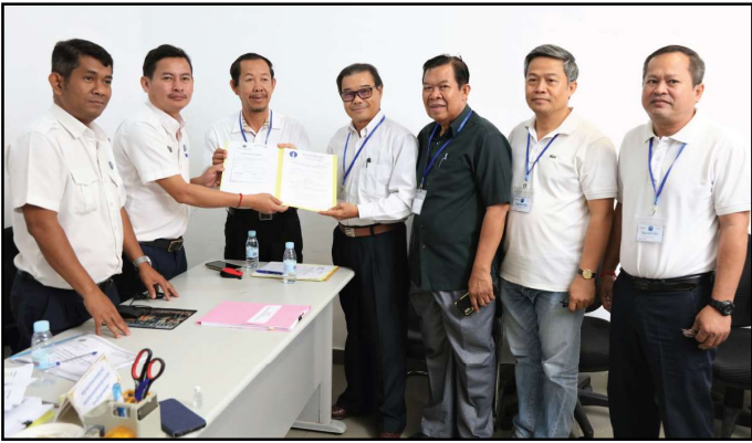
គណបក្សភ្លើងទៀន