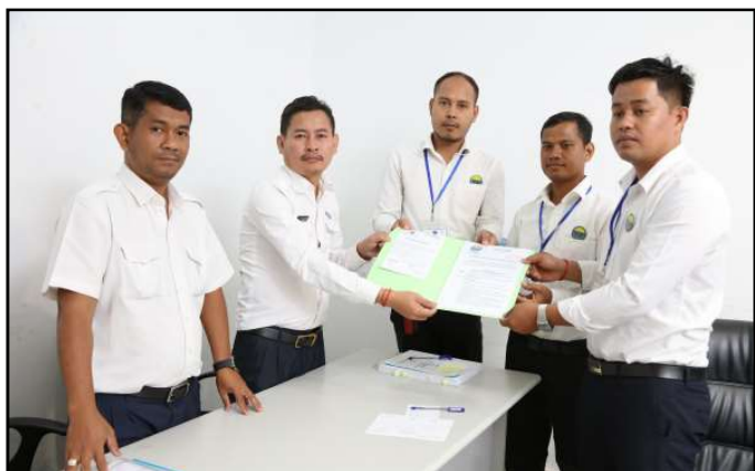
គណបក្សខ្មែរតែមួយ