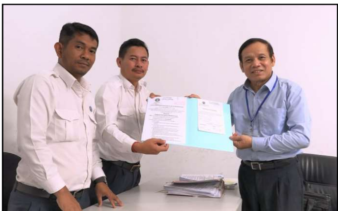
គណបក្សខ្មែរអភិរក្ស