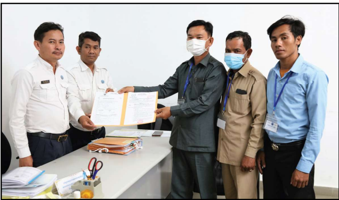
គណបក្សមហាសាមគ្គីជាតិខ្មែរ