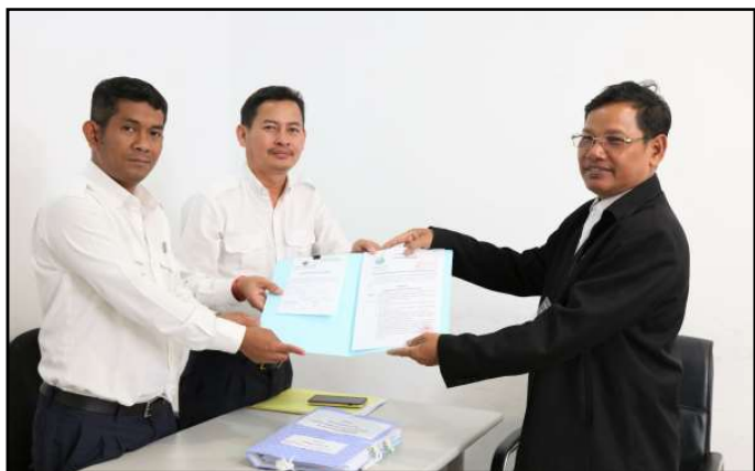
គណបក្សប័ណ្ណឯកលរដ្ឋ