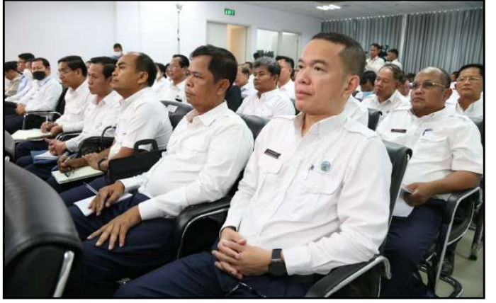
អ្នករាជការ គ.ជ.ប ចូលរួមក្នុងពិធីបើកវគ្គបណ្តុះបណ្តាល

ឯកឧត្តមបានគូសបញ្ជាក់ថា ផ្អែកតាមបទពិសោធន៍ពីការបោះឆ្នោតមុនៗ និងជោគជ័យនៃការរៀបចំការបោះឆ្នោតជ្រើសរើសក្រុមប្រឹក្សាឃុំ សង្កាត់ អាណត្តិទី៥ ឆ្នាំ២០២២ ព្រមទាំងលទ្ធផលនៃអង្គសន្និបាតបូកសរុបការងារបោះឆ្នោតកន្លងទៅនេះ គ.ជ.ប បានពិនិត្យ និងកែលម្អការងារបច្ចេកទេសបោះឆ្នោតមួយចំនួន សំដៅរៀបចំការបោះឆ្នោតជ្រើសតាំងតំណាងរាស្ត្រ នីតិកាលទី៧ ឆ្នាំ២០២៣ ឱ្យកាន់តែមានភាពល្អប្រសើរថែមមួយកម្រិតទៀត តាមរយៈការអនុម័តបទបញ្ជា និងនីតិវិធីសម្រាប់ការបោះឆ្នោតជ្រើសតាំងតំណាងរាស្ត្រ នីតិកាលទី៧ ឆ្នាំ២០២៣