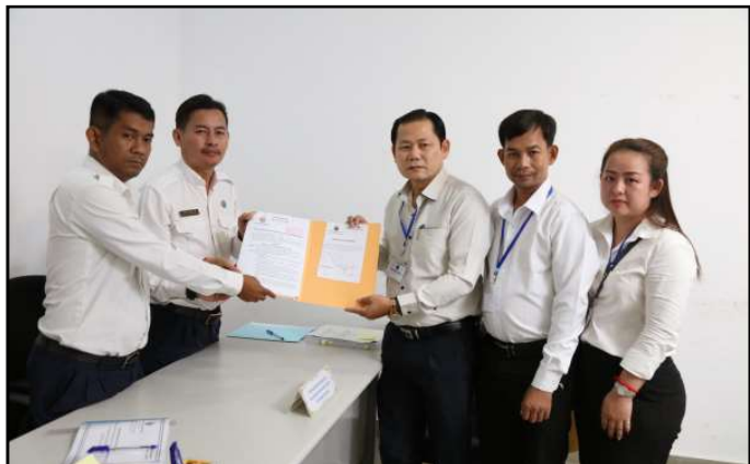
គណបក្សកម្លាំងប្រជាធិបតេយ្យ