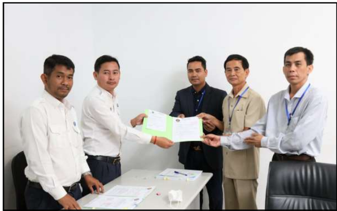
គណបក្សហ្វ៊ុនស៊ិនប៉ិច