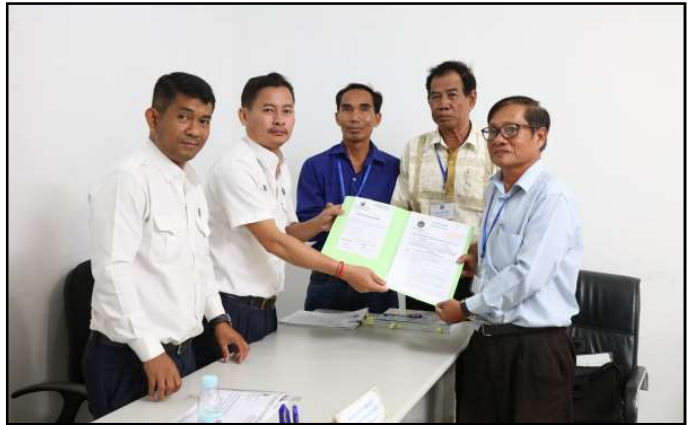
គណបក្ស ខ្មែរវប្បធម៌ជាតិ