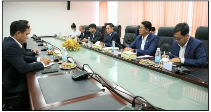
សកម្មភាពក្នុងជំនួបពិភាក្សា

ប្រមាណមួយម៉ោង ប្រកបដោយភាពស្និទ្ធស្នាល និងយោគយល់គ្នា។