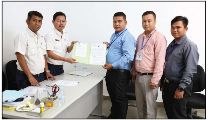
គណបក្សខ្មែរអភិវឌ្ឍន៍សេដ្ឋកិច្ច