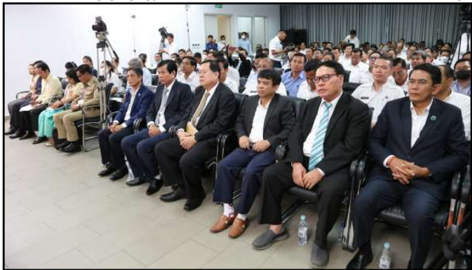
សកម្មភាពក្នុងពិធីបិទវគ្គបណ្តុះបណ្តាល