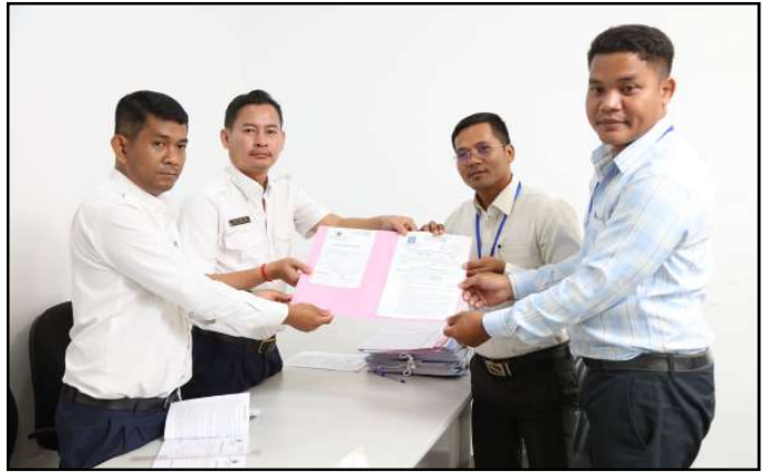
គណបក្សយុវជនកម្ពុជា