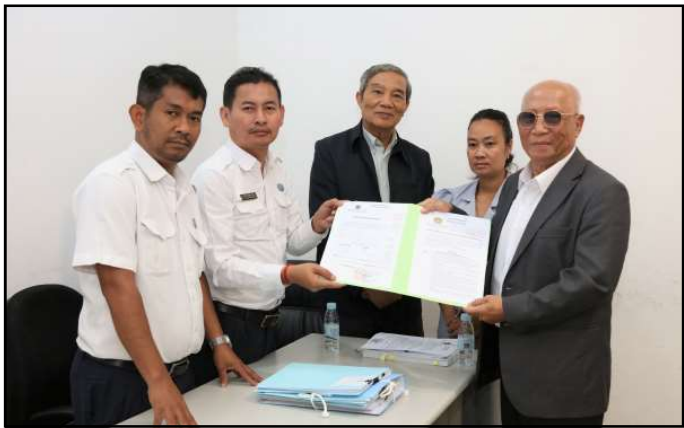
គណបក្សសំបុកឃុំសង្គមប្រជាធិបតេយ្យ