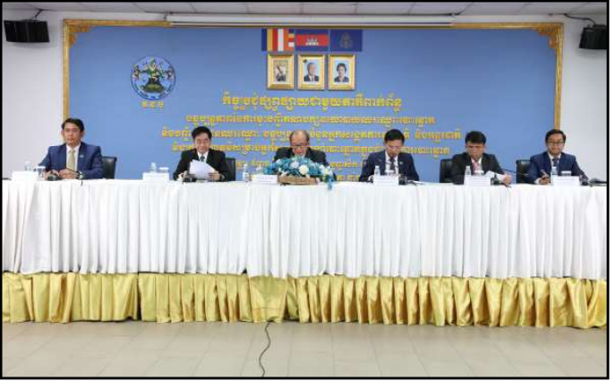
សកម្មភាពក្នុងកិច្ចប្រជុំជាមួយភាគីពាក់ព័ន្ធ

រដ្ឋាភិបាលក្នុងស្រុក ដែលបានចុះបញ្ជីនៅក្រសួង- មហាផ្ទៃ និងអនុញ្ញាតដោយ គ.ជ.ប