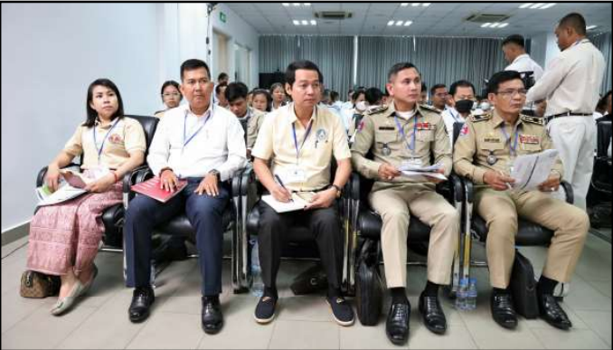
តំណាងភាគីពាក់ព័ន្ធចូលរួមក្នុងពិធីបើកវគ្គបណ្តុះបណ្តាល

ឯកឧត្តមបានមានប្រសាសន៍បន្ថែមទៀតថា អនុលោមតាមច្បាប់ស្តីពីការបោះឆ្នោតថ្មី និងច្បាប់ស្តីពីវិសោធនកម្មនៃច្បាប់ស្តីពីការបោះឆ្នោតនានា ចាប់តាំងពីឆ្នាំ២០១៦ មក គ.ជ.ប បានរៀបចំ ចាត់ចែង និងគ្រប់គ្រងការងារចុះឈ្មោះបោះឆ្នោត និងការ