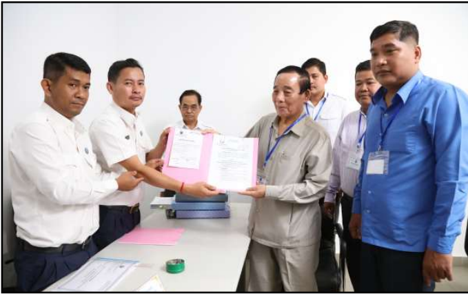
គណបក្សប្រជាជនកម្ពុជា