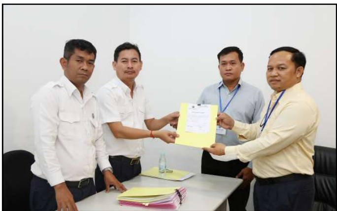
គណបក្សឯកភាពជាតិខ្មែរ