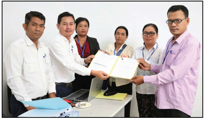
គណបក្សខ្មែរឈប់ក្រ