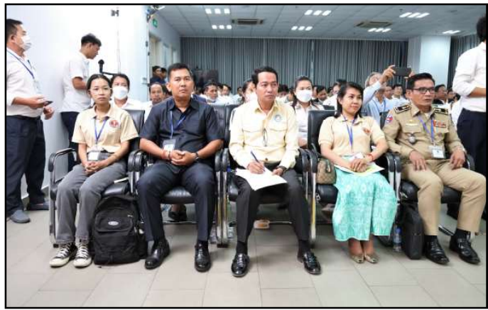
តំណាងភាគីពាក់ព័ន្ធចូលរួមក្នុងពិធីបិទវគ្គបណ្តុះបណ្តាល

ឯកឧត្តមប្រធាន គ.ជ.ប បានបន្ថែមថា ក្រៅពីការកសាង លិខិតបទដ្ឋានគតិយុត្តដែលមានលក្ខណៈល្អប្រសើរ និងគ្រប់ ជ្រុងជ្រោយ ការបណ្តុះបណ្តាលដើម្បីពង្រឹងសមត្ថភាពដល់មន្ត្រី បោះឆ្នោតគ្រប់លំដាប់ថ្នាក់ ព្រមទាំងភាគីពាក់ព័ន្ធឱ្យមានការយល់ ដឹងច្បាស់លាស់អំពីច្បាប់ បទបញ្ជា និងនីតិវិធីនៃការបោះឆ្នោត គឺជាកត្តាសំខាន់ដែល គ.ជ.ប ត្រូវយកចិត្តទុកដាក់អនុវត្តឱ្យ